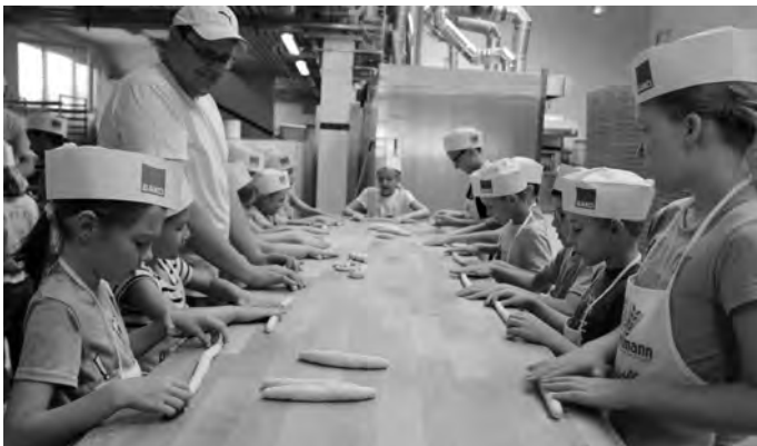
Foto: Brezeln backen bei der Bäckerei Pickelmann